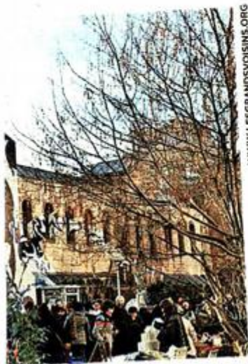
PARIZ Umjetnički projekt u jednom od transformiranih prostora

Zanimljivo je da kreativne industrije koje bi bile dobar dio korisnika tih mogućih budućih novouređenih prostora zauzimaju i kod nas visoko mjesto u BDP-u. ■